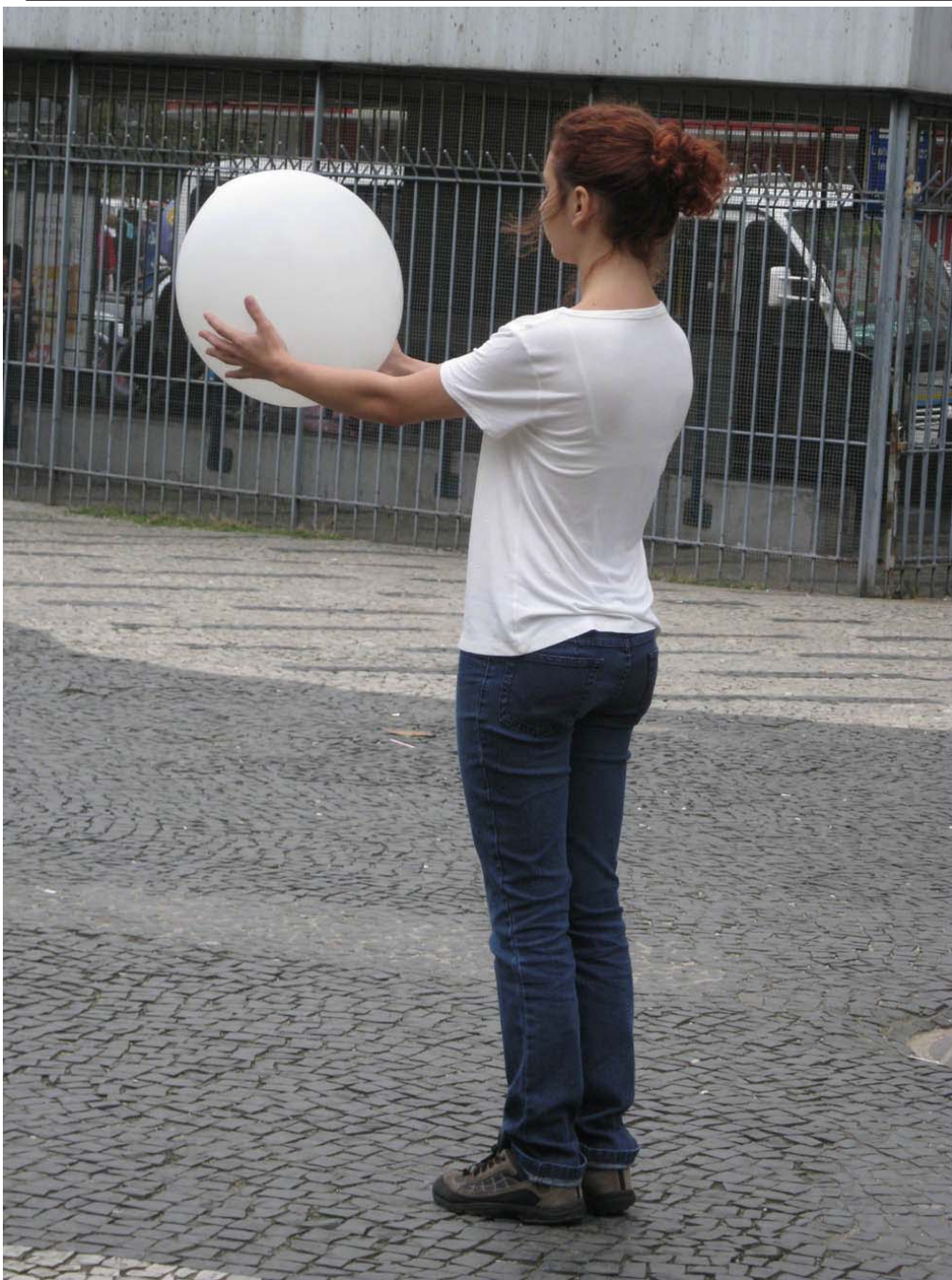
Momento 1 de Homenagem ao olho .