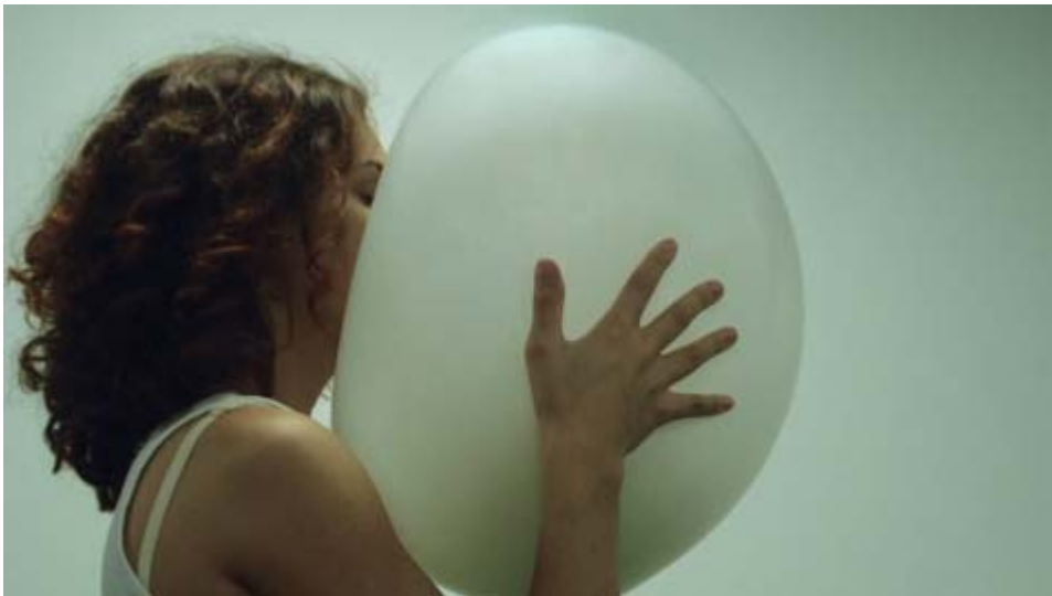
Momento 5 de Homenagem ao olho .

Luana trás a bola até seu rosto ao ponto de um possível sufocamento e depois retorna com ela para posição inicial. Alcança o limite. O momento ao qual chamei de 5 está baseado na seqüência de fotos que Marcelo Nogueira nos forneceu.